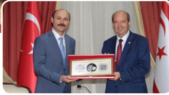
K.K.T.C. Başbakanı Ersin TATAR, UAESEB Heyetini Makamında Kabul Etti.