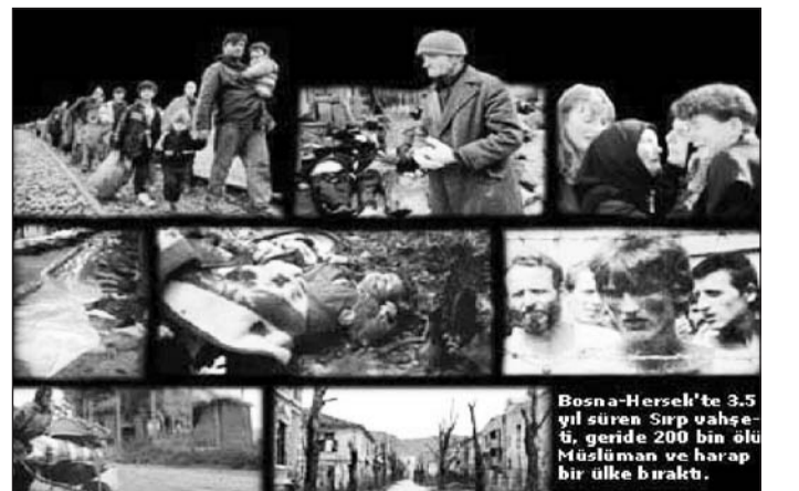
Bosna-Hersek'te 3,5 yıl süren Sırp vahşeti, geride 200 bin ölü Müslüman ve harap bir ülke bıraktı.

Bu vesileyle Türk Eğitim Sen olarak binlerce müslümanı acımadan katleden canileri nefretle kınarken, katliamda hayatlarını kaybeden binlerce Müslüman dindaşımıza Allah'tan rahmet diliyoruz.