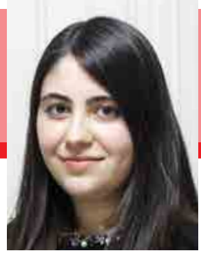
Av. İsmihan Kübra AKKAŞ

14 Mart 2014 tarih ve 28941 sayılı Resmi Gazetede yayımlanan Millî Eğitim Temel Kanunu İle Bazı Kanun ve Kanun Hükmünde Kararnamelerde Değişiklik Yapılmasına Dair Kanununun 25. maddesiyle 652 sayılı KHK'ya eklenen Geçici 10. Maddesinde "Bu maddenin yürürlüğe girdiği tarih itibarıyla halen Okul ve Kurum Müdürü, Müdür Başyardımcısı ve Yardımcısı olarak görev yapanlardan görev süresi dört yıl ve daha fazla olanların görevi, 2013-2014 ders yılının bitimi itibarıyla başka bir işleme gerek kalmaksızın sona erer. Görev süreleri dört yıldan daha az olanların görevi ise bu sürenin tamamlanmasını takip eden ilk ders yılının bitimi itibarıyla başka bir işleme gerek kalmaksızın sona erer." şeklinde değişiklik yapılmıştır.