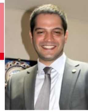
Av. Buğrahan BİLGİN