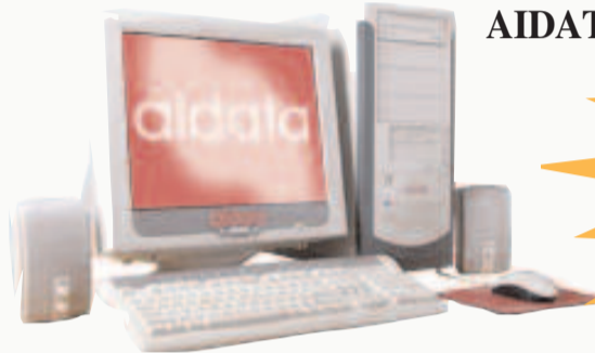
AIDATA Spectra AS-2850