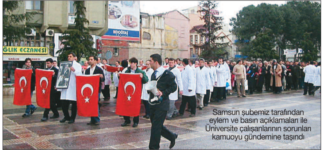
Samsun şubemiz tarafından eylem ve basın açıklamaları ile Üniversite çalışanlarının sorunları kamuoyu gündemine taşındı

Üniversiteler bilimin beşiğidir. Bilim demokrat olmayı gerektirir, o halde üniversiteler demokrasinin her zerresine kadar işlediği yerler olmalıdır.