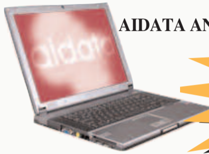
AIDATA AN-360 Notebook

mize ücretsiz ve reklamsız web alanı ve ücretsiz pop3 destekli mail adresi vermek için çalışmalarımız sürüyor. Bu maksatla şu anda web serverlerimizi büyütüyoruz. Bağlantı hızımızı arttırıyoruz. Yakında fiberoptik bağlantı teknolojisi ile, 10 Mbps hızla çalışacak serverlerimiz hizmete girecektir. Bu bağlantı hızıyla Türkiye'nin en hızlı servis sağlayıcılarından birine sahip olacağız ve bu hizmeti üyelerimize sunacağız.